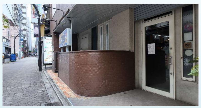
※マップは概要紹介図です。形状等が現況と異なる場合は現況優先となります