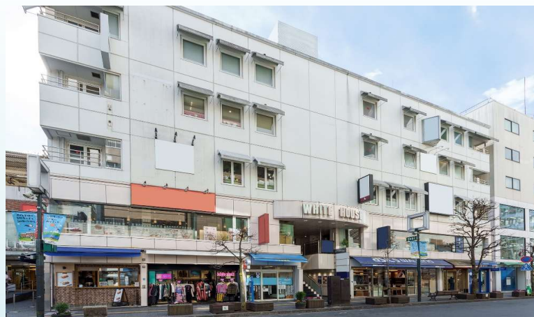
※ハウジングマップは概要紹介図です。形状等が現況と異なる場合は現況優先となることをご了承願います